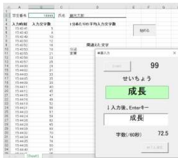
図 1 Excel のユーザーフォームを利用した入力画面

せる仕組みである。漢字であれカタカナであれ、読みがひらがなで表示されるようになっている。文字入力後 Enter キーを押すと正誤が判定され、結果にかかわらず次の語が表示される。これを 3 分間繰り返す。フォーム右上には正解入力文字数の累計が表示され (ワークシートには入力時刻とともに自動的に記録されていく)、これを元に計算した 1 分間あたりの入力文字数の推定値が画面右下に表示される。誤って入力した語句も自動記録される。市販のタイピングソフトや Web 上の練習プログラムでは読みを入力するだけのものが多いが、このシステムでは漢字への変換も含めた速さを計測しており、実際の文章入力スピードに近いと言える。