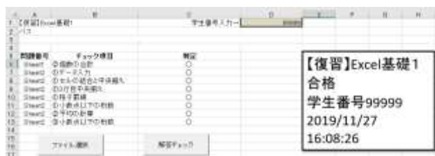
図 3 Excel 課題の自動採点システム

自動採点の最大の利点は、学生が課題作成後すぐに正否をチェックできることであろう。誤りがあればその場で訂正し、質問することができる。時間のかかる課題チェックを短縮でき、授業中の無駄な待ち時間をなくし、また授業後の教員の負担を減じるメリットもある。一方、自動採点は、指示通りの文書を作成させる点では効果を発揮するが、コーディングの都合上、学生の創意工夫に基づく文書作成には対応することが難しい[4]。定型文書の作成チェックには自動採点を取り入れ、自由課題には通常の採点を行うなど使い分けが必要であろう。また、正解であるにもかかわらず、プログラムの想定外の解答に対しては×になってしまい、混乱を招く恐れがある。なるべく多様な解答に対応できるよう心掛けていても、思わぬ見落としがあるものである。