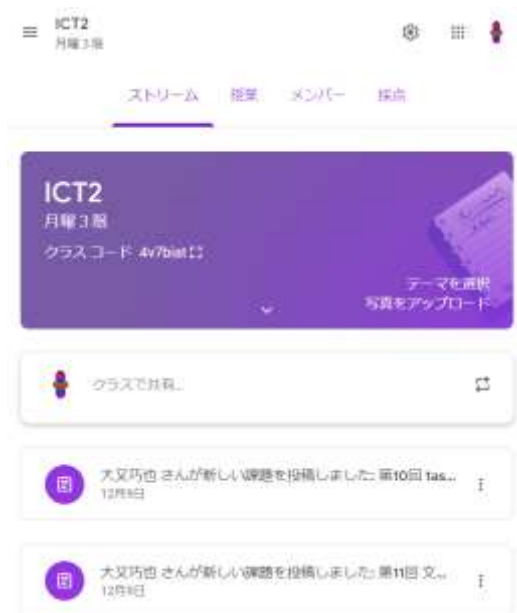
図 4 Classroom のストリーム画面

アンケート調査は Google Forms を用いてアンケートの提示と回収を行った。アンケートフォームと回答は Google ドライブに保存され、回答の集計はスプレッドシートアプリで行うことができるが、Excel 形式でダウンロードすることもできる。