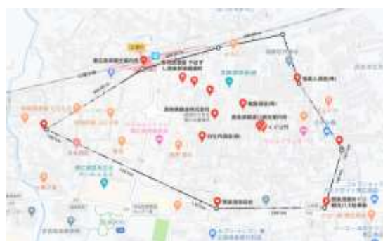
図 3 西条の酒蔵立地 (Google マップより筆者加工 | 黒太線が酒蔵エリアの面積範囲)