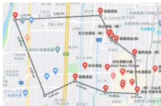
図 2 伏見の酒蔵立地 (Google マップより筆者加工 | 黒太線が酒蔵エリアの面積範囲)