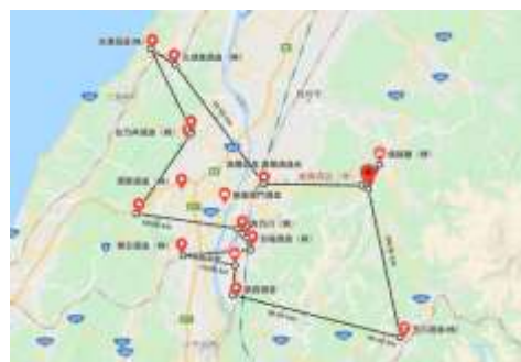
図 5 長岡市の酒蔵立地 (Google マップより筆者加工 | 黒太線が酒蔵エリアの面積範囲)