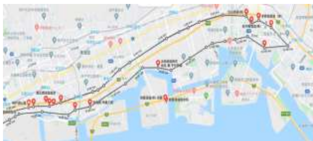
図 1 灘五郷の酒蔵立地 (Google マップより筆者加工 | 黒太線が酒蔵エリアの面積範囲)

この酒蔵エリアを阪急電鉄、JR 西日本、阪神電鉄の 3 社の路線が通るため交通アクセスの優れた地域といえる。灘五郷は阪神電鉄の今津駅、西宮駅、魚崎駅、御影駅、住吉駅、大石駅などが最寄り駅となり、それぞれの駅間の所要時間も 10 分以内のため、エリアをまたいでのプランも組みやすい。駅を降りてから酒蔵エリアまでも 10 分～15 分ぐらいと便利である。鉄道やバスなどの公共交通機関があることは、飲酒を伴う観光行動がその中心となる酒蔵ツーリズムのポテンシャルを大きく高めているといえる。分散立地型では公共交通機関では訪れにくい場所も多く、個人の場合はタクシーなどを利用するケースも目立つ。