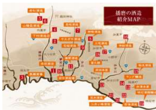
図 6 はりま酒文化ツーリズム 酒蔵所在地図 (はりま酒文化ツーリズム 2019)

播磨地区の酒蔵で観光に積極的に取り組んでいるのは、明石の「江井ヶ島酒造(神鷹)」、姫路の「灘菊酒造(灘菊)」と「本田酒造(龍力)」、加西市の「富久錦(富久錦)」などがある。これらは、「富久錦」を除いては、すべて海側の明石~姫路エリアにあり、関西圏から比較的訪れやすいエリアにある。「富久錦」は 1992 年から生産する日本酒の全量を純米酒にした「純米酒だけをつくる」蔵として知られ日本酒ファンの間で人気がある。しかし、最寄り駅が JR 加古川駅より JR と私鉄を乗り継いで約 1 時間の山間部にあるため個人客が公共交通機関を利用して「富久錦」と他の海側にある酒蔵を組み合わせ、短時間の中で訪れることは難しいと言える。